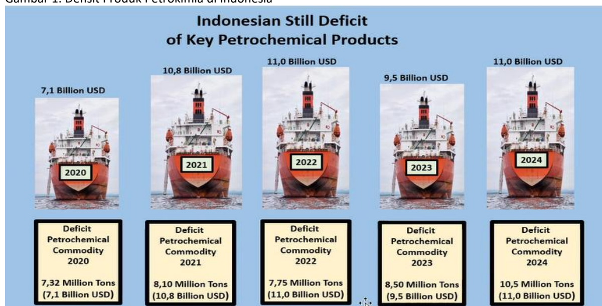
Gambar 1: Defisit Produk Petrokimia di Indonesia

Meskipun margin komoditas global/regional tertekan, permintaan domestik Indonesia menunjukkan potensi pasar yang besar. Data Inaplas yang bersumber dari Kementerian Perindustrian menunjukkan bahwa Indonesia berada dalam kondisi net importir produk petrokimia dari tahun 2020 hingga 2024, artinya permintaan dalam negeri jauh melebihi kapasitas produksi lokal.